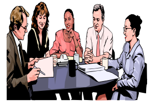
Riunione di lavoro