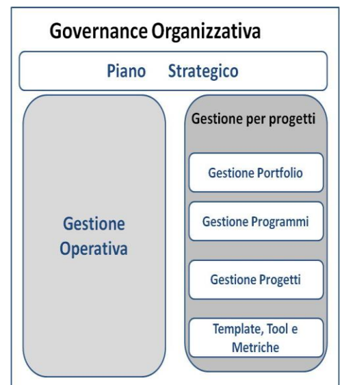
Figura 2 - Schema di Governance

Ne consegue una maggiore o minore disponibilità di risorse da non confondere con la gestione del budget, che segue altri tipi di valutazioni.