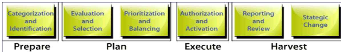
Figura 3 - Ciclo di Vita di PortfolioStep

Il processo di Portfolio Management TenStep, denominato PortfolioStep , prevede un ciclo di vita di quattro fasi principali: Preparazione, Pianificazione, Esecuzione e Raccolta dei risultati .